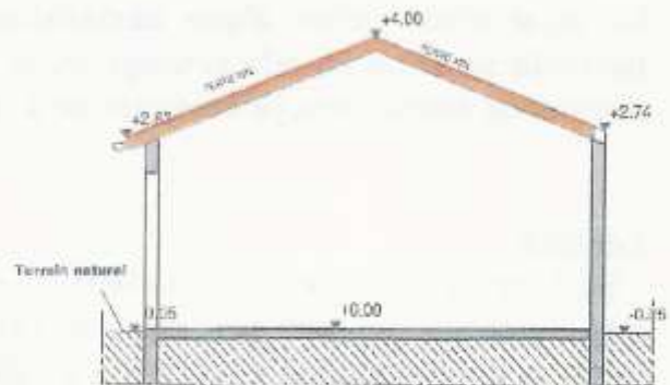
Plan de coupe