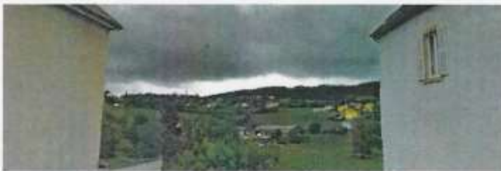
Photographie situant le terrain dans le paysage lointain